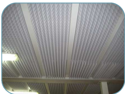
Pyramidenplatten mit Klebeschicht