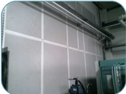
Wandflächen nicht vergessen