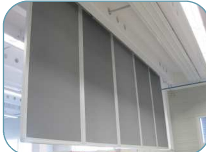
Unterbrechung mit Elementen