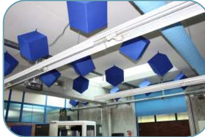
In Farbe oder weiß