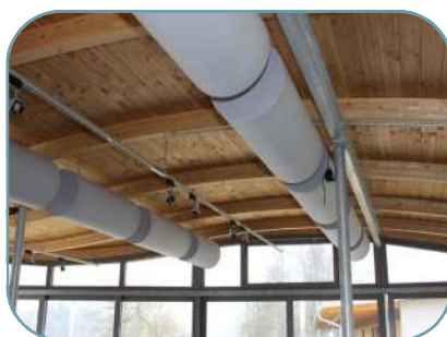
Auch runde Zylinder –