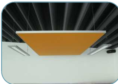
Auch in Farbe