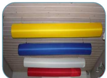
in Farbe sind kein Problem